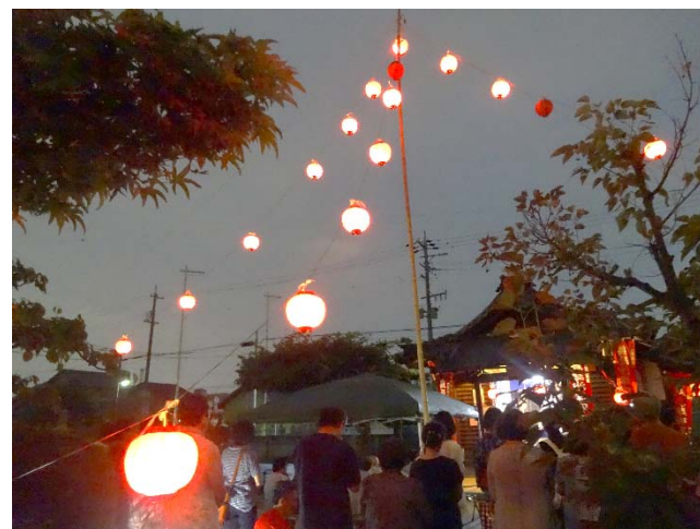
<<烏瑟沙摩明王様大祭の様子>>

当寺のウスサマはトイレの神様としてだけではなく、婦人科疾患の平癒、 妊娠祈願、安産祈願、心願成就の御利益があります。